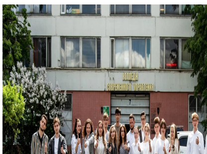
Вход в колледж

Фельдшер в медпункте колледжа осуществляет мероприятия по профилактике заболеваний среди сотрудников и студентов. Раз в год все студенты проходят диспансеризацию, своевременно проводятся плановые профилактические прививки от дифтерии, столбняка гепатита «В» и др.