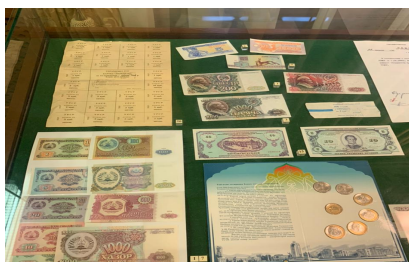
Музей Центрального Банка Российской Федерации