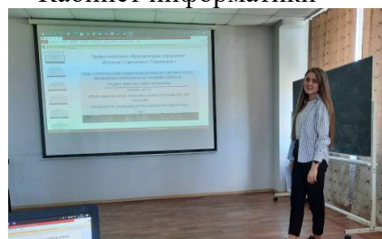
Кабинет социально-экономических дисциплин

Информатизация образовательного процесса является необходимым направлением деятельности колледжа в современных условиях и представляет собой комплекс мероприятий по внедрению новых информационных технологий, как совокупности программно-технических средств, вычислительной техники, а также приемов, способов и методов их применения при выполнении функций сбора, хранения, обработки, передачи и использования информации.