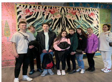
Выставка достижений народных художников