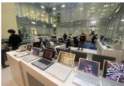
Музей техники Apple