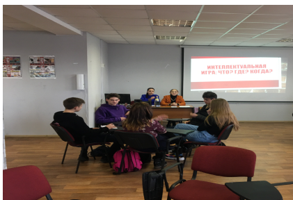
Что? Где? Когда?

В стенах колледжа проводятся такие конкурсы как: конкурс газет, плакатов; просмотр патриотических видеороликов, конкурсы рисунков «Я и моя профессия», «День учителя» «Здоровый образ жизни», «День мужества», «День защитника Отечества», «Международный Женский День», «День космонавтики», «Цену Победы – знаем, подвиг героев – помним!», «Подвигу народа жить в веках».