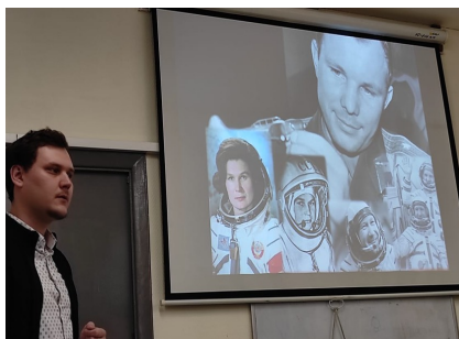
12 апреля- День космонавтики