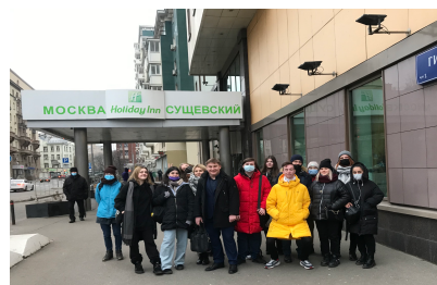
Урок – экскурсия Гостиница Holiday Inn Сушевская