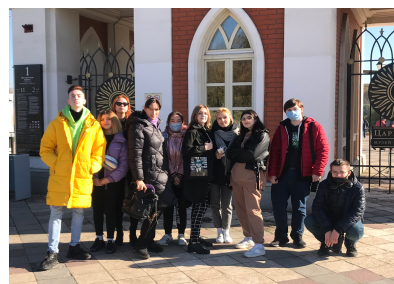
Музей- Заповедник «Царицыно»